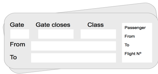
Fig. 1. (Boarding pass. Fuente: elaboración propia).