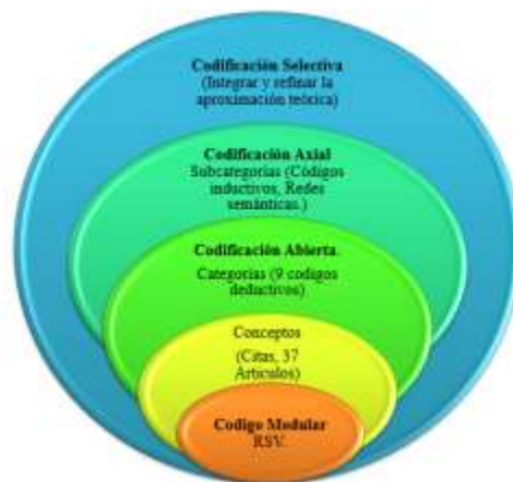
Fig. 1. Representa el desarrollo metodológico cualitativo de codificación realizado en la investigación mediante Atlas. Ti 7

Las categorías, son analizadas individualmente a partir de redes semánticas de sentido (Atlas.ti 7), éstas permiten interconectar las citas de las categorías para formar las subcategorías, darles sentido y sustentarlas teóricamente. Esto se sustenta en las herramientas de “códigos” y “familias” que brinda el software. La implementación de las redes semánticas permite la relación teórica, la construcción del estado del arte y el análisis estructural de las categorías, en busca de la codificación selectiva, que es el proceso de integrar y refinar la aproximación teórica.